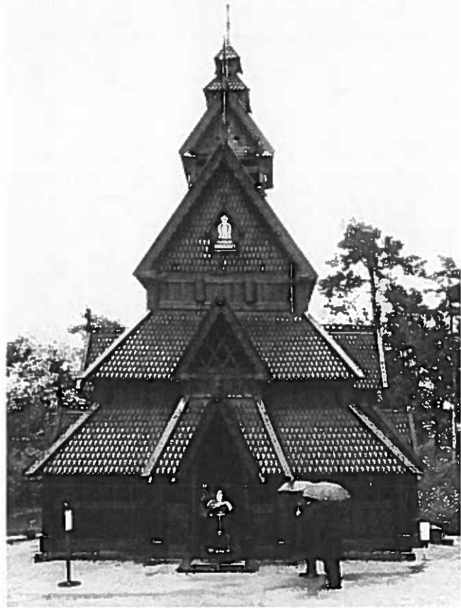
3. Gol Stavkirke, Norsk Folkemuseum, Oslo (mit Holzteer imprägnierte Stabkirche), Exkursion im Rahmen der 8th Session of the European Heritage Heads Forum (EHHF) vom 23./24. Mai 2013 in Oslo/Norwegen

Dennoch betrifft die europäische Normgebung in Zuständigkeitsbereichen der Europäischen Union, wie z. B. der Umwelt, der Agrarpolitik, der Bildungspolitik oder den Arbeits- und Sozialbedingungen zunehmend den Schutz unserer Bau- und Bodendenkmäler sowie unserer Kulturlandschaften. Selbstverständlich will europäische Normgebung bauliches und archäologisches kulturelles Erbe wohl niemals absichtlich verletzen oder bedrohen. Aller-