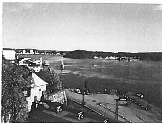
4. Blick aus Akershus Castle, Halbinsel Akersnes, Oslo, auf den Oslofjord, anlässlich des Abendempfangs und Festbanketts im Rahmen der 8th Session of the European Heritage Heads Forum (EHHF) vom 23./24. Mai 2013 in Oslo/Norwegen

Dies scheint mir die in staatsrechtlicher Hinsicht erstrebenswerte „Idee von Europa“ zu sein. Zudem meine ich erkennen zu können, dass EU und EU-Kommission dies im Einklang mit den Statuten des Europarates und den EU-Verträgen bereits wesentlich umfassender verinnerlicht als dies in manchen Mitgliedstaaten der Fall zu sein scheint. Europa stünde besser bzw. hervorragend da, hätten wir in diesem Sinne mehr Litauen und mehr Politiker des Formats von Frau Staatspräsidentin Dr. Dalia Grybauskaitė. Das Bewusstsein einer europäischen Identität begründet sich eben nicht allein aus einer geographischen Zugehörigkeit, sondern entscheidend aus gemeinsamen Werten, nicht selten auch über die Grenzen kultureller Unterschiede hinaus. Solche soll es sogar im heutigen Freistaat Bayern geben, ohne dass es erwähnenswerte Stimmen für dessen Teilung gäbe. Alexandre Kojève und Giorgio Agamben ist aus tiefer Überzeugung Recht zu geben: ein zerstückeltes Europa wird nie aus dem gegenwärtig wieder etwas deutlicher spürbaren Gefühl der Unsicherheit herauskommen, es wird unweigerlich von anderen Mächten zumindest