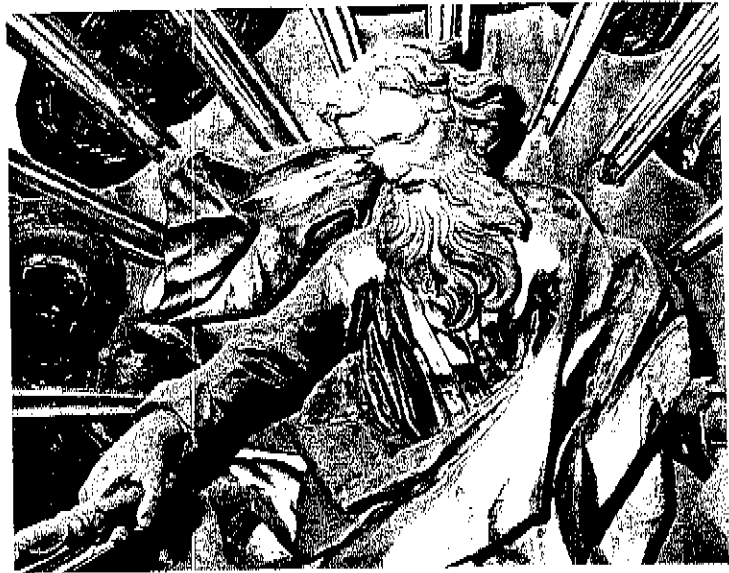
Maria-altaar, God de Vader, voor restauratie | Foto: Bayerisches Landesamt für Denkmalpflege