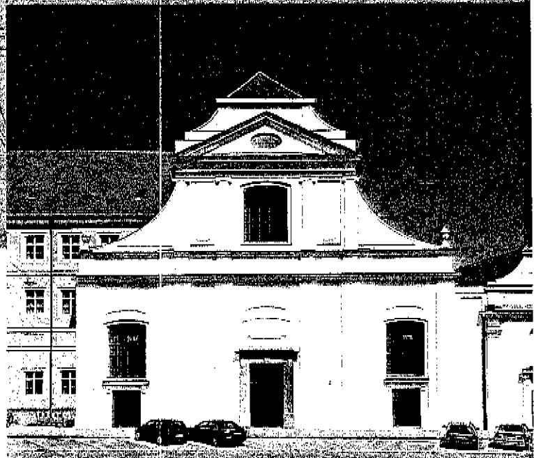
Westelijke façade Dominicanerkerk in Landshut

De hoogste monumentenzorginstantie in de deelstaten is een verantwoordelijk deelstaatministerie of een regeringsinstan-