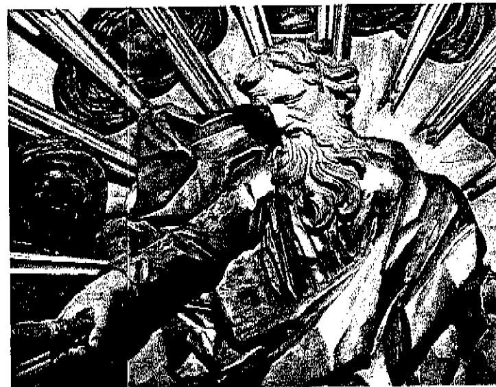
Maria-altaar, God de Vader, na restauratie

met deze ondernemingen is het vermelden extra waard. Nu het totale project is afgerond kunnen de vrijstaat Beieren, de regering van Niederbayern, het Staatliche Hochbauamt Landshut en het Beierse Landesamt für Denkmalpflege blij zijn met het succes van de binnen slechts twaalf jaar geconcentreerde, probleemgerichte samenwerking aan dit opvallende sacrale bouwwerk en kunnen ze het gebouw weer aan het publiek teruggeven in het besef dat er voor het eerst in de geschiedenis van het monument een daadwerkelijk duurzame renovatie is uitgevoerd.