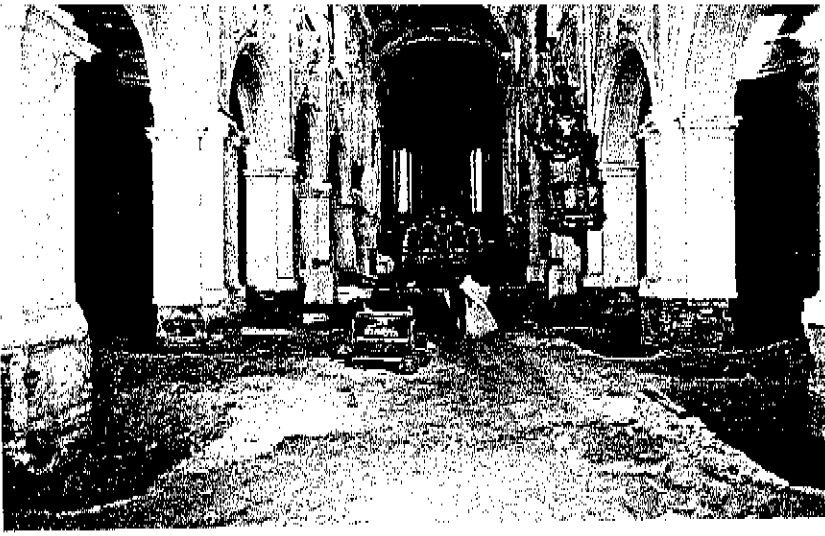
Ontgraven materiaal in het middenschip Dominicanerkerk onder het schutdak